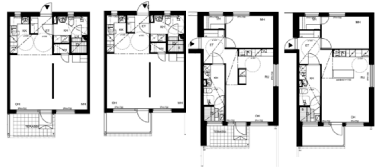
2 H+KK+S 46m 2 1.KRS C14 (PEILIKUVA) C15 C16 (PEILIKUVA) C17