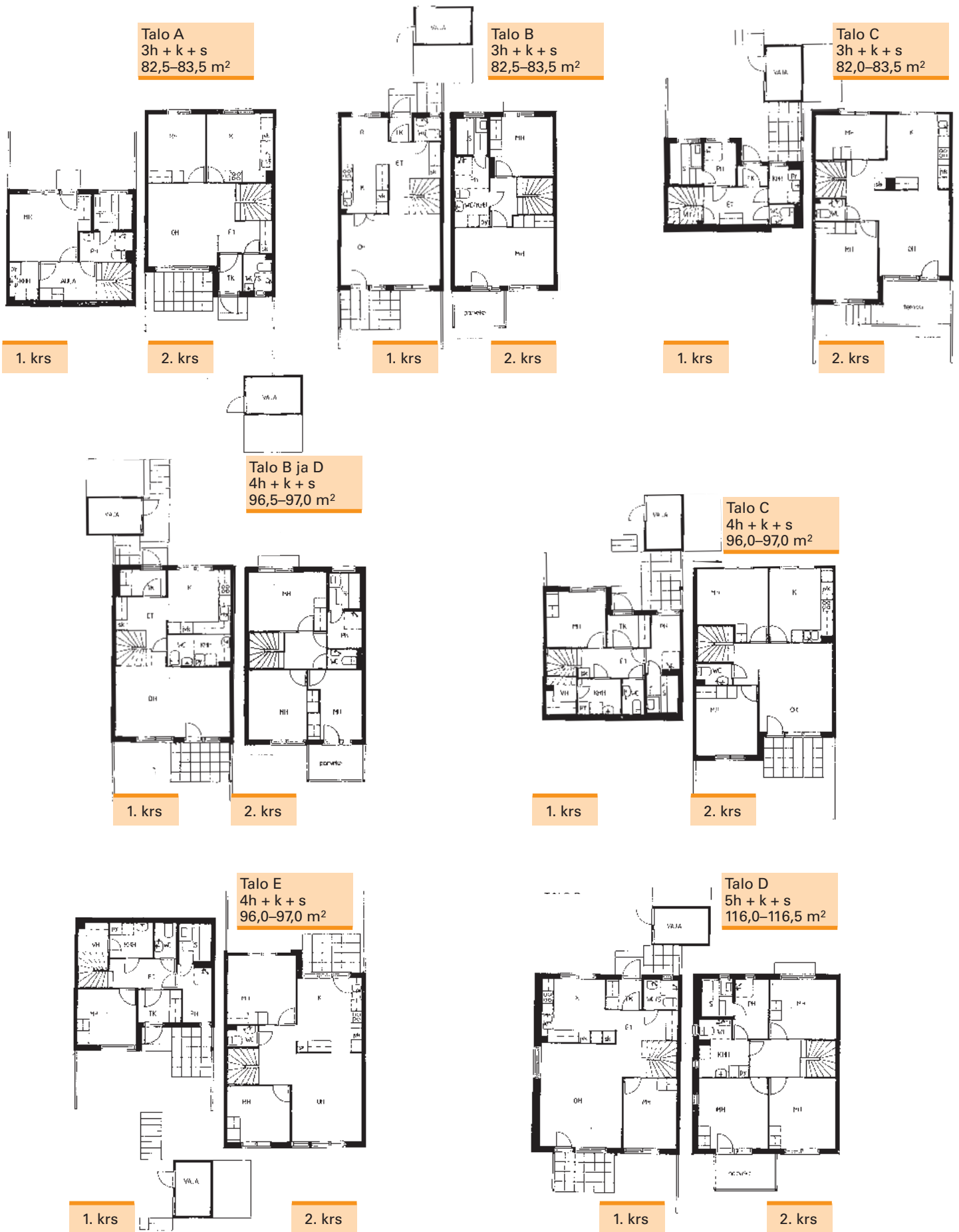
Talo A 3h + k + s 82,5–83,5 m 2